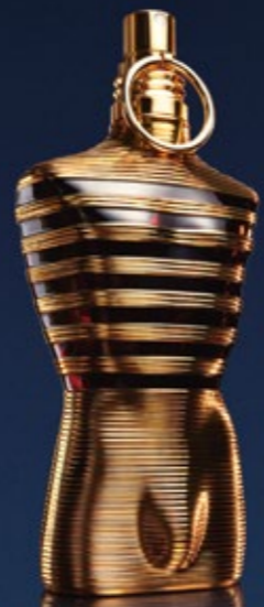
THE NEW INTENSE PERFUME