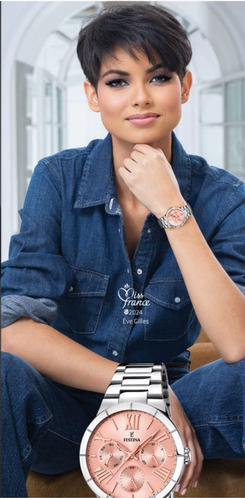
Miss France 2024 Eve Gilles