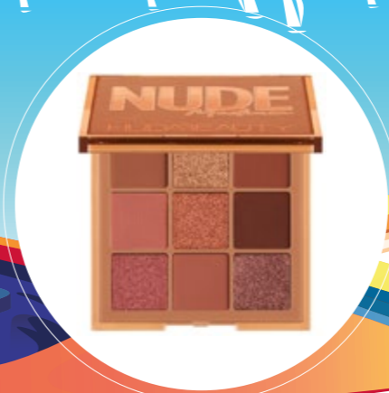
HUDA BEAUTY MINI PALETTE 9 OMBRES P. 11