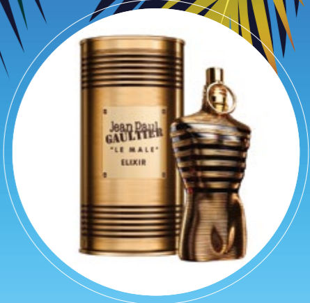
JEAN PAUL GAULTIER LE MÂLE ELIXIR P. 8