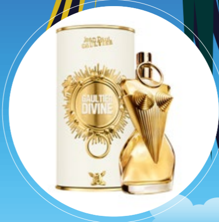
JEAN PAUL GAULTIER DIVINE P. 4

SERVICE CLIENTS INFLIGHT SALES GROUP EUROPE Services Clients isg.customer@isgeurope.eu Les ventes sont effectuées par la Société Inflight Sales Group Europe.