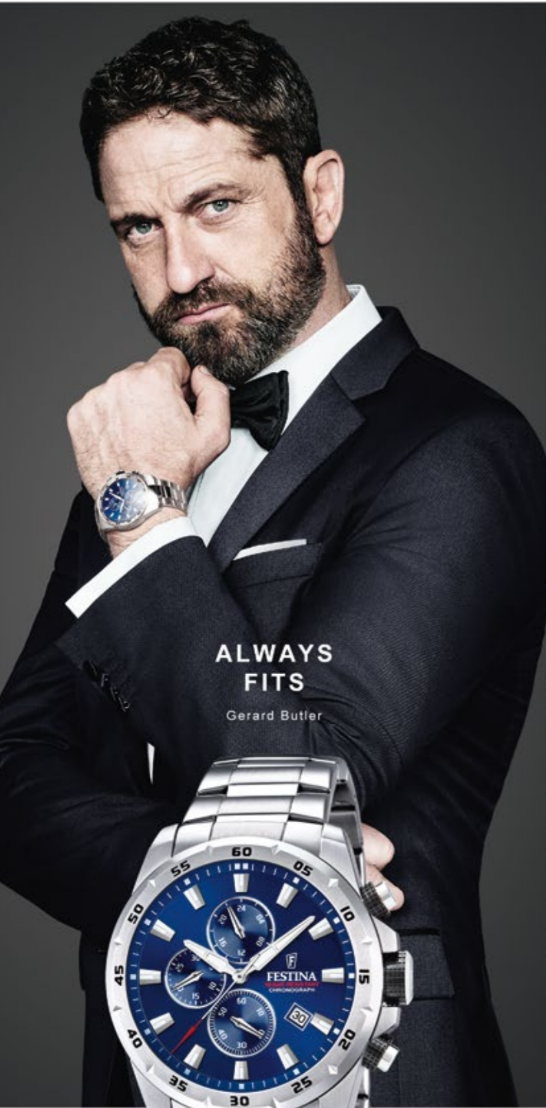
ALWAYS FITS Gerard Butler