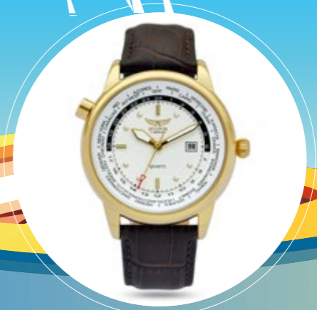
AVIATOR RETRO CLASSIC MODEL 4 P. 23