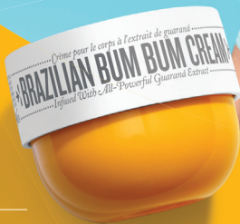
BRAZILIAN BUM BUM CREAM 75ML