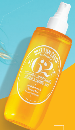
CHEIROSA 62 PERFUME MIST 90ML